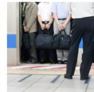
密を避けた通勤/通学に 乗り換えせずに駅から オフィスまでドアツードア