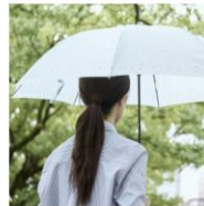
雨の日のお出かけに

利用時間：7:00-20:00 エリア エリア：地図内どこでも乗り降り自由 料金：無料 予約締め切り：前日23時まで 実施期間：2021年4月1日～4月14日（平日）