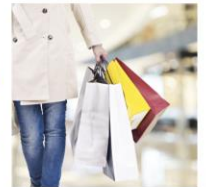
荷物が多い日の外出に/通学に