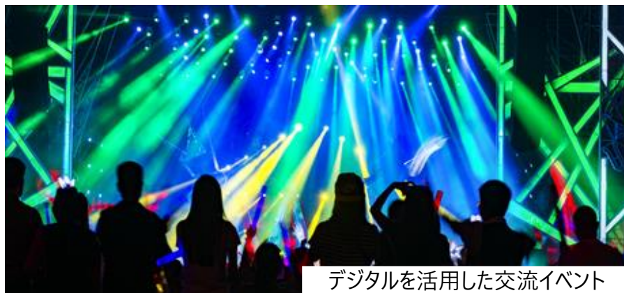
デジタルを活用した交流イベント

個人のニーズに合った情報や地域内コミュニティ活動の情報が 手に入ることで「人與人」「人と都市」がつながれる状態