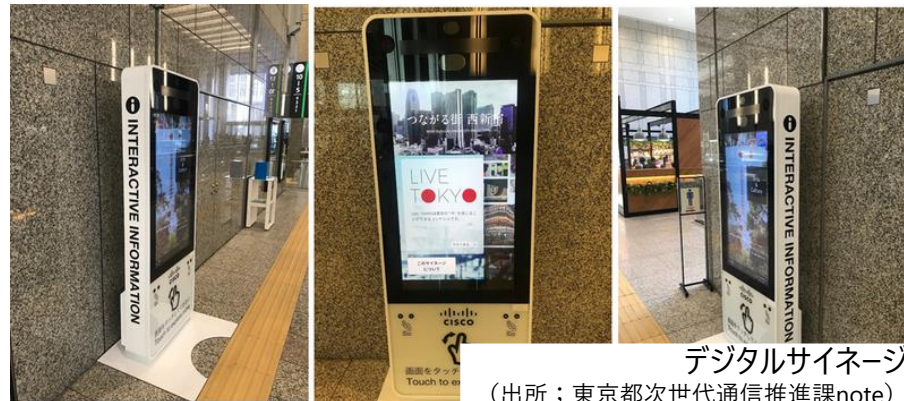
デジタルサイネージ