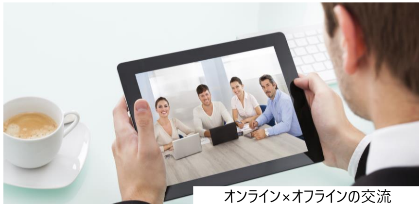
オンライン×オフラインの交流